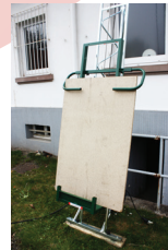
Cadre à plaques vertical pour les métiers de l'aménagement : poseurs de fenêtres, plaquistes, plâtriers.