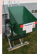
Benne pendulaire manuelle pour les travaux du bâtiment et de la rénovation.